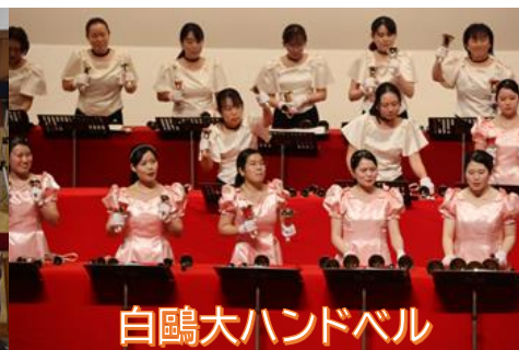
白鷗大ハンドベル