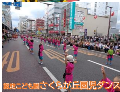
認定こども園さくらが丘園児ダンス