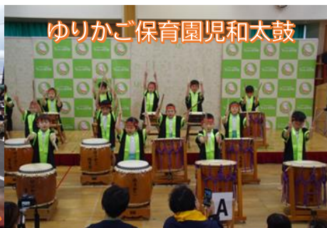
ゆりかご保育園児和太鼓